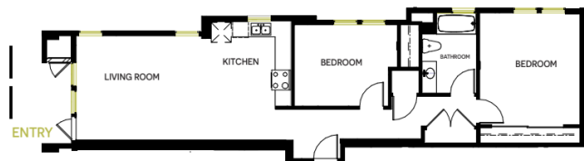
210 LAFAYETTE CIRCLE | UNIT #103